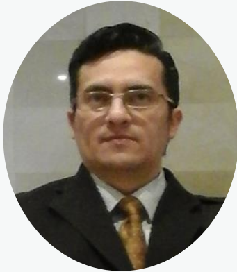
Coordinador de Comercio Exterior CCQ